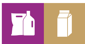
Plast / Mad- & drikkekartoner