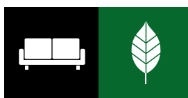
Storskrald / Haveaffald