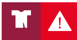
Tekstilaffald / Farligt affald