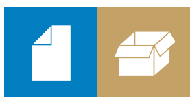
Papir / Pap