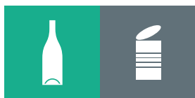
Glas / Metal